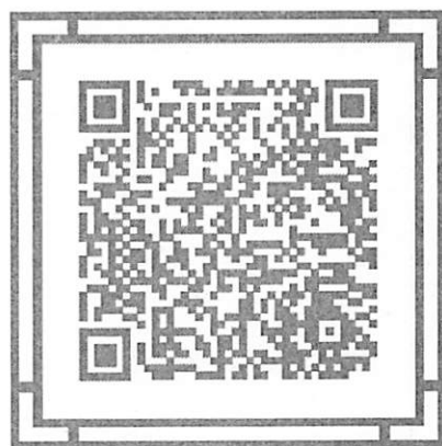
企业吸纳就业政策