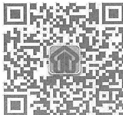
三门峡就业微信公众号