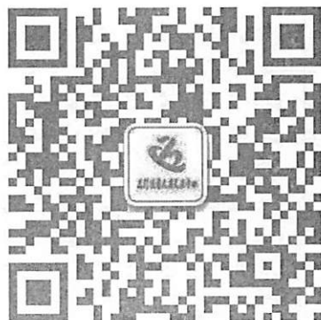
三门峡市人才交流中心微信公众号